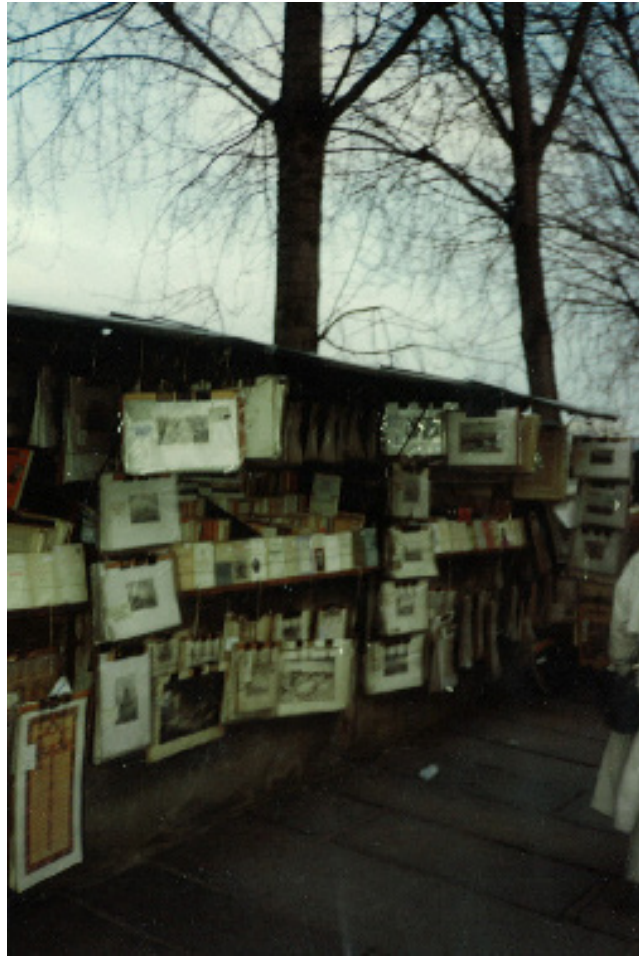
Boklådor vid Seine, mysiga att strosa förbi.