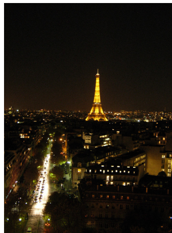
Eiffeltornet, sett från toppen av Triumfbågen.