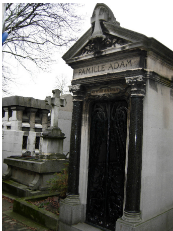
Familjen Adams bor tydligen i Necropolis på Père Lachaise.