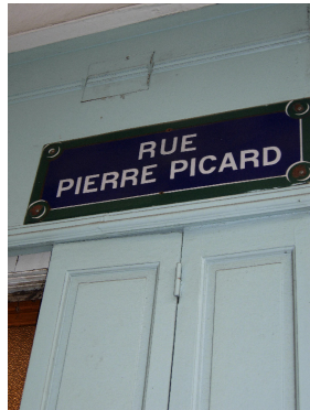
Förfader till Jean-Luc?