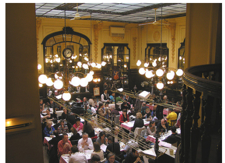
Den k-märkta inredningen på Chartier är mycket charmig.