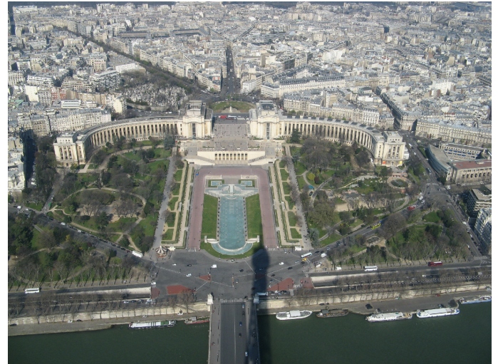
Place de Trocadero, sett från Eifelltornets tredje våning. Notera skuggan...

Eifelltornet rekommenderas inte att bestiga om man har svindel, men däremot bör man absolut se det. Åk till Place Trocadero, och skåda ner mot tornet från platsen. Gå sedan ner till tornet (ni passerar Rue Gustav V de la Suede, så kan ni känna er rojalistiska och tänka på svenska kungahusets franska bakgrund) och hissna över hur högt det är. Det går tyvärr inte längre att gå raka vägen in under tornet utan man måste av förklarliga skäl passera en säkerhetskontroll för att ens komma dit. Dessutom kan det vara en fördel att boka biljett till hissarna i förväg.