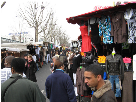
Loppmarknaden vid Porte de Clingancourt.

Skivor, böcker och filmer handlar man förövrigt på Fnac! Glöm inte det och trevlig resa!